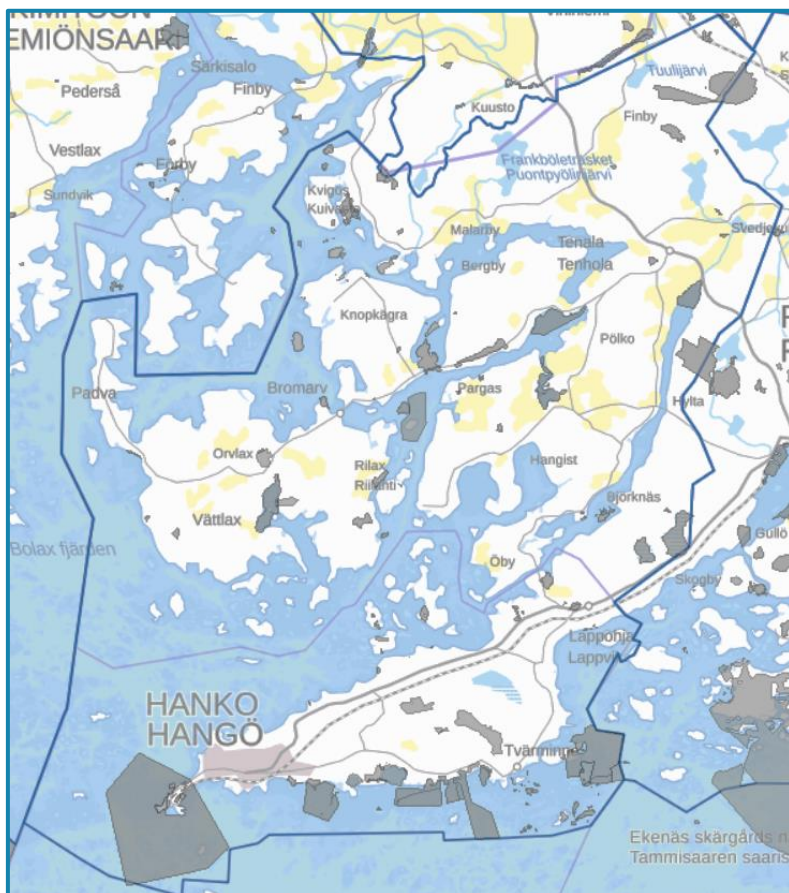
Karta över Västra Nylands fiskeriområde med djupzoner och naturskyddsområden