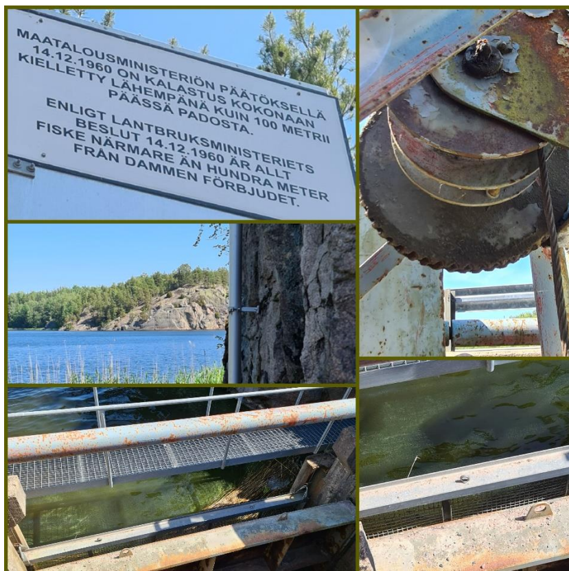
Collage från utfärden till Stagsund i juni 2023